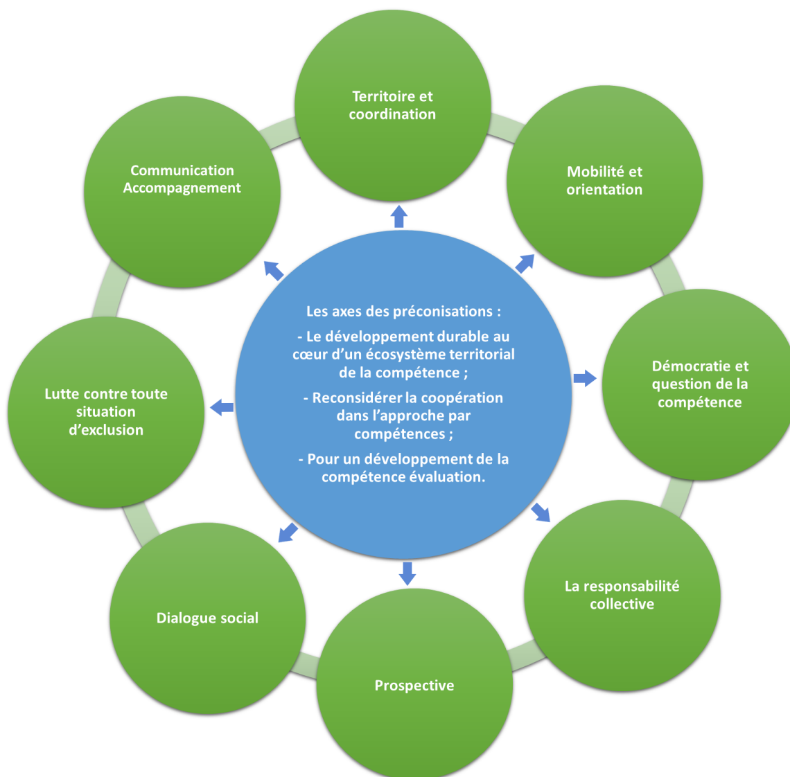
Schéma des huit thématiques

Suite à la présentation des préconisations réparties dans les 3 axes de l'avis sur le « Développement des compétences d'aujourd'hui et de demain : quels enjeux de l'école à l'entreprise ? », les débats se sont organisés autour de huit thématiques, indissociables les unes des autres afin d'assurer une formation, un développement des compétences tout au long de la vie.